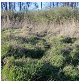
Grasfilz im Schilf - geliebt von Hummeln!