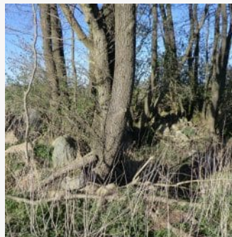
Nistplätze für Wildbienen und Rückzugsräume für Amphibien: Besonnte Lesesteinhaufen

Verzicht auf den Einsatz von Insektiziden