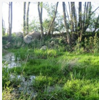
versteckte Oasen der biologischen Vielfalt