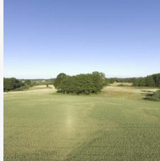
Moorfroschinseln im Weizenacker

Die Gemeinde Dargelin ist kaum touristisch erschlossen. Die schöne Landschaft und Straßen mit sehr geringem Verkehrsaufkommen laden unter anderem zu Radtouren ein. Direkt neben der Projektfläche gibt es einen Tisch und Bänke zum Picknicken. Besonders während der Abendstunden ist das Verweilen hier sehr stimmungsvoll und es lassen sich zahlreiche Tiere beobachten.