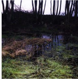
Nachts am Feldsoll - Jetzt ist die Zeit der Moorfrösche