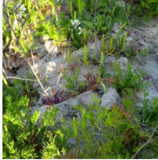
Mäuseschwänzchen im Mai 2020