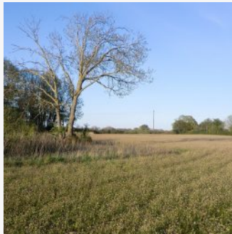
Ackerschmalwand-Schleier im Mai 2020