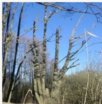
Totholz lebt! Auch hier können Wildbienen nisten.