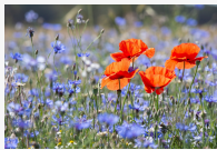
Blühaspekt mit Ackerwildkräutern

Im Juni 2019 waren wir mit unserer Investorin vor Ort. Dabei erfolgte auch die Erfassung der Pflanzenkennarten in drei Transekten. Auf der Fläche konnten zu diesem Zeitpunkt 4 bis 6 Kennarten je Transekt für artenreiches Ackerland nachgewiesen werden. Während der Begehung wurden Moorfrösche am Gewässerrand beobachtet.